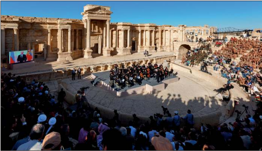
Освобожденная Пальмира. На концерте симфонического оркестра петербургского Мариинского театра под руководством народного артиста России Валерия Гергиева в Римском амфитеатре сирийской Пальмиры, освобожденной от террористов ИГИЛ.