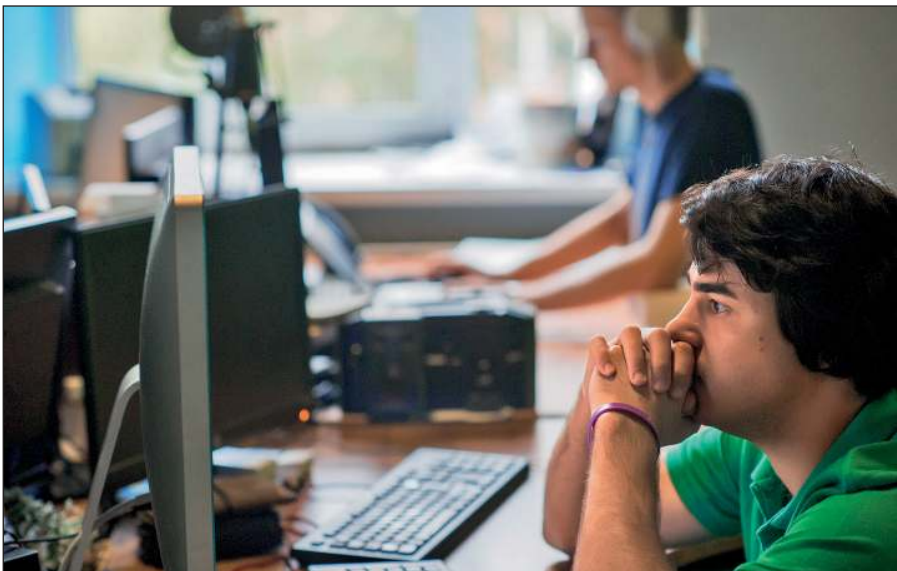
Постоянное присутствие вербовщиков ИГИЛ в соцсетях.

Активисты ИГИЛ поддерживают свои аккаунты в сетях Facebook, Twitter, Instagram, Friendica, Telegram. Активно они заявили о себе и в российских социальных сетях: «ВКонтакте» и «Одноклассниках».