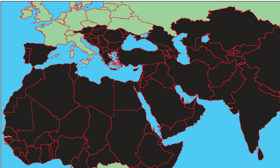
Карта мироустройства ИГИЛ

В настоящий момент группировка контролирует часть территории Сирии, а также ряд провинций в Ираке.