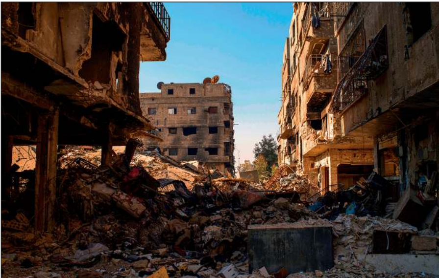
Разрушенный боевиками ИГИЛ Дамаск.

Террористы поставили на поток производство видеороликов с жестокими сценами казней пленников, заложников и «вероотступников». Эти материалы потом широко распространяются в социальных сетях и