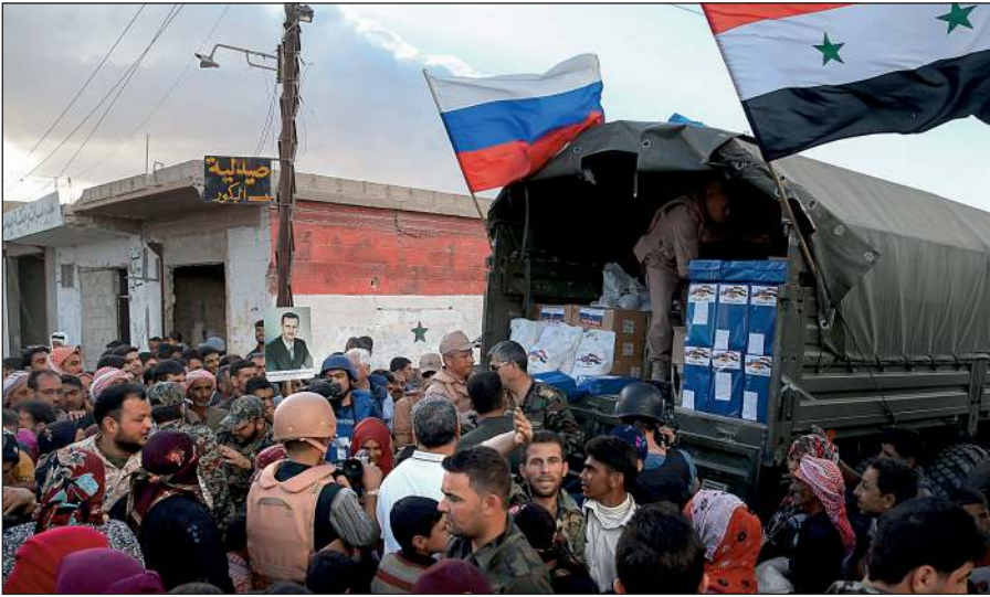
Россия оказывает гуманитарную помощь Сирии.