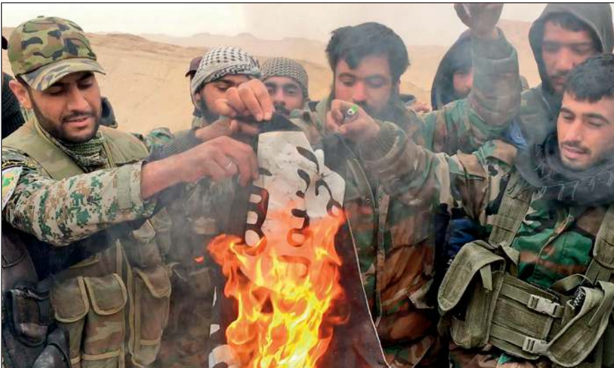
Народные ополченцы САР сжигают флаг ИГИЛ, снятый с отбитой у боевиков цитадели Пальмира.

Современное государство обязано защищать интересы каждого своего гражданина вне зависимости от его расы, национальности, принадлежности к определенной конфессии или религиозной традиции, в то время как ИГИЛ выражает интересы небольшой группы религиозных радикалов, жестоко подавляя остальную часть населения посредством запугивания, насилия и террора.