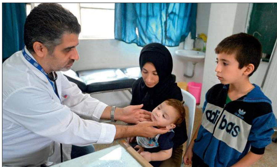
Истинный ислам призывает к состраданию и милосердию. Врач осматривает ребенка в медицинском пункте лагеря при одной из школ Дамаска.

Радикалы объявляют «врагами ислама» всех несогласных с ними мусульман. Ультрарадикальные группировки признают террор и насилие единственным способом достижения провозглашенных ими целей.