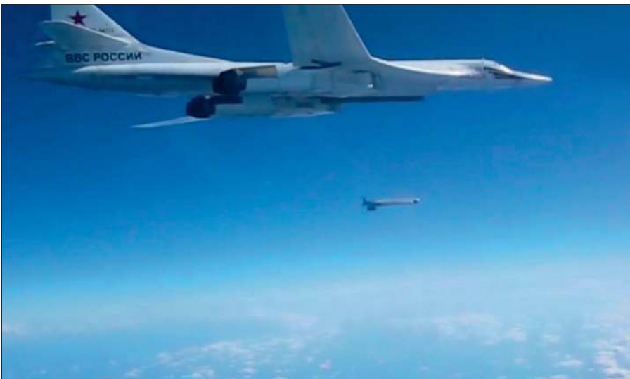
Воздушная операция российских ВКС по уничтожению боевиков ИГИЛ в Сирии.