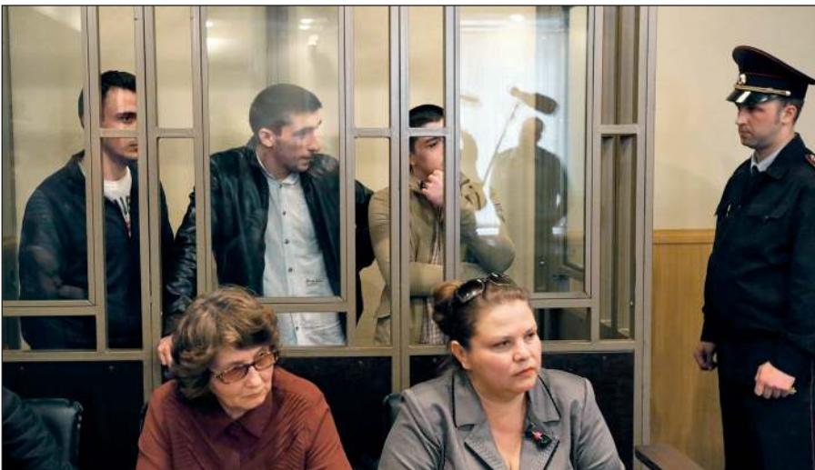
В Российской Федерации предусмотрена административная и уголовная ответственность за пропаганду идей терроризма, участие в деятельности террористических организаций.