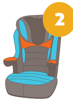
15-25 кг от 3 до 7 лет