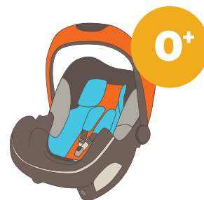
0-13 кг от рождения до 1 года