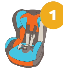
9-18 кг от 9 месяцев до 4 лет