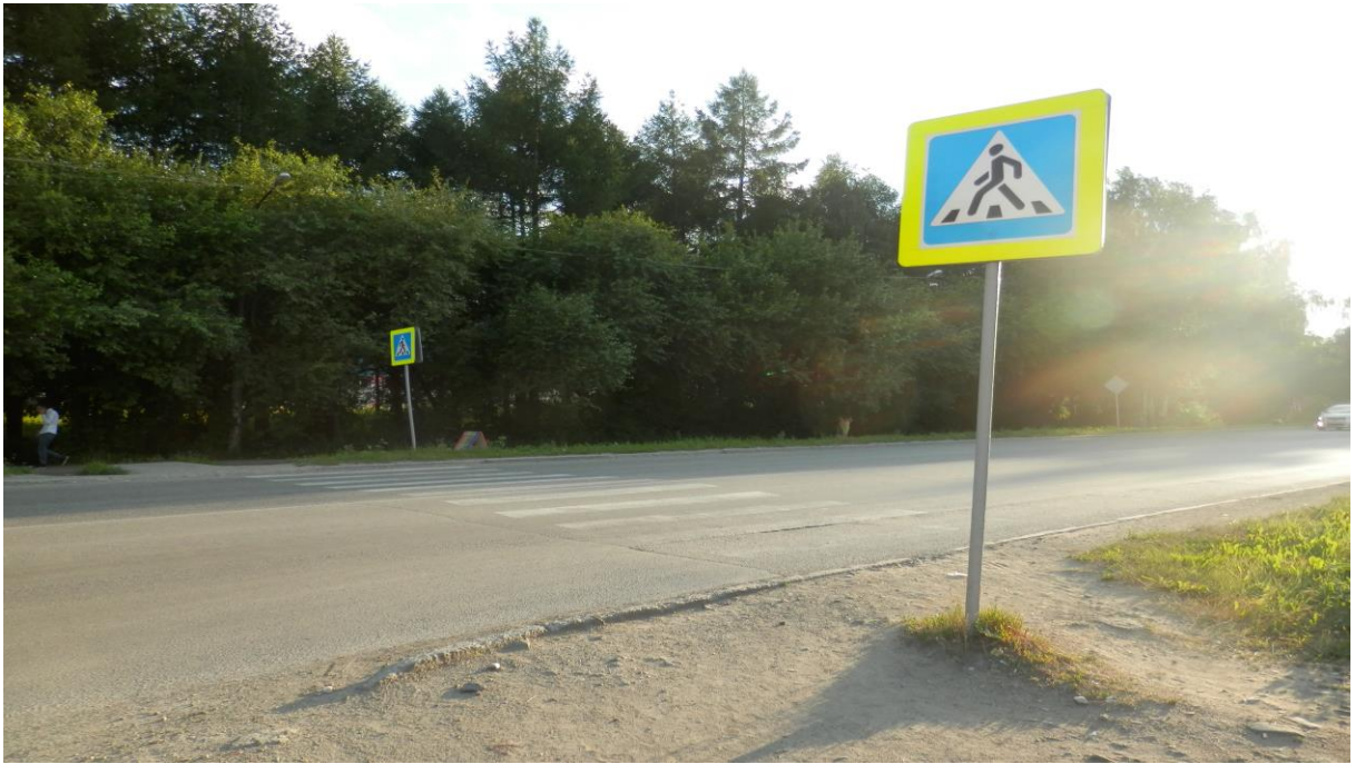
Пешеходный переход на улице Ленина (Около «ТЦ Куприт»)