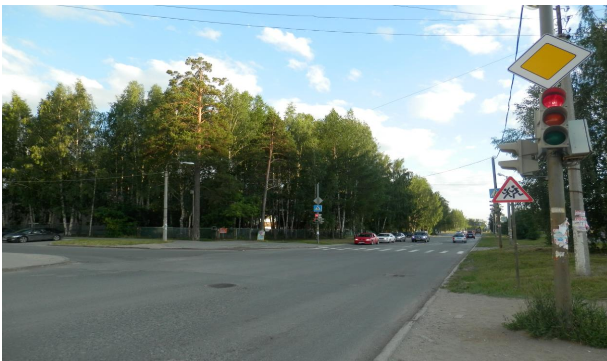
Перекресток Уральских рабочих – Кривоусова