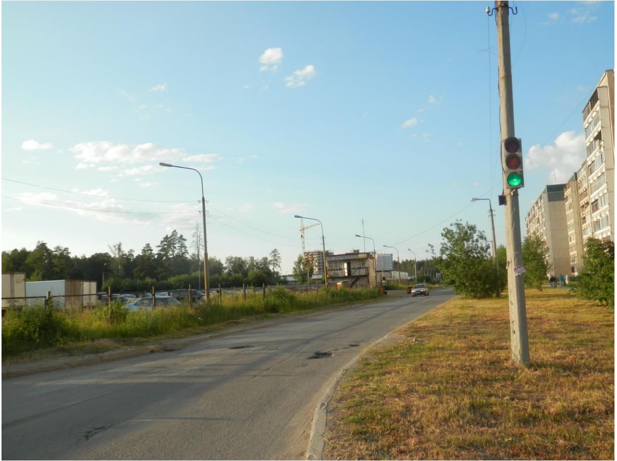
Улица Машиностроителей, ведущая к МАОУ «СОШ №3»