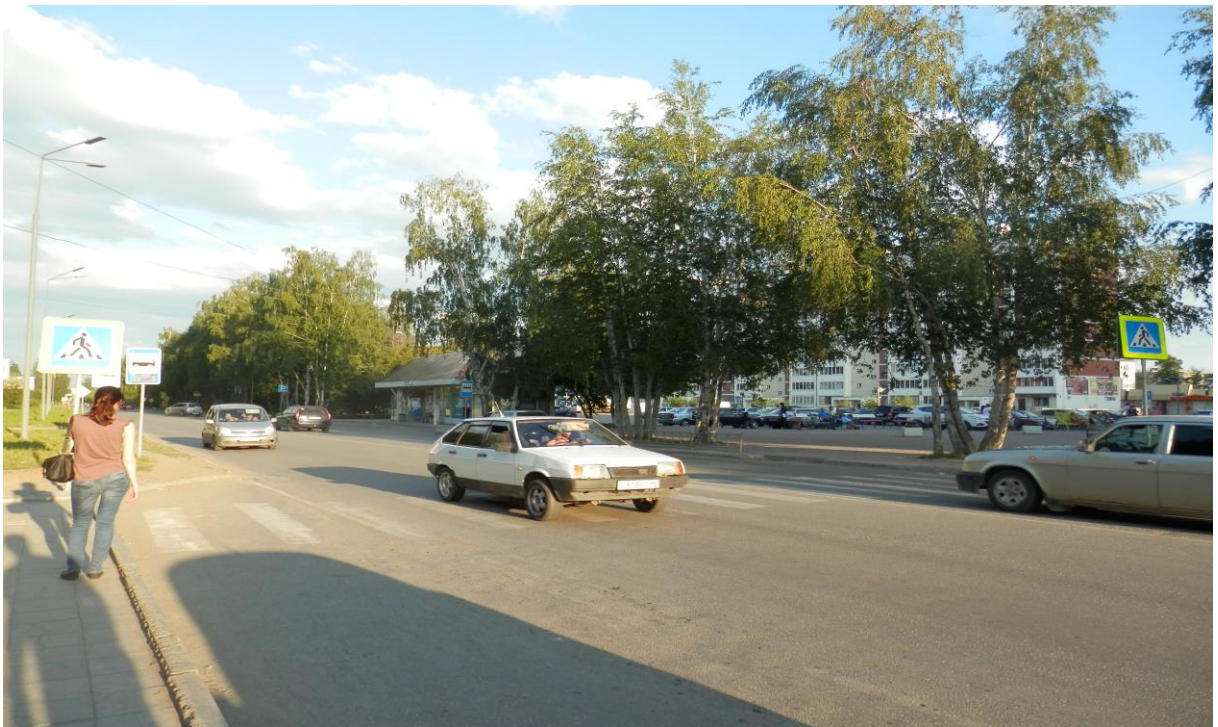
Пешеходный переход на улице Ленина (Около ТЦ «VIP город»)