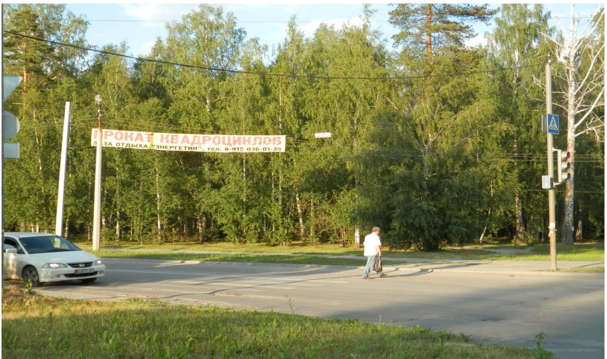
Пешеходный переход на перекрестке улиц Уральских рабочих - Ленина