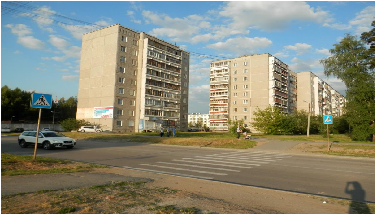
Пешеходный переход на улице Уральских рабочих (Остановка «ТЦ Куприт»)