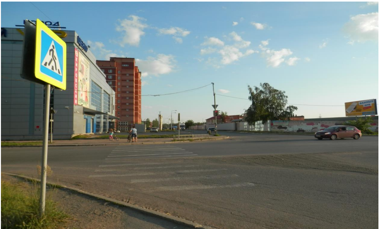
Пешеходный переход Огнеупорщиков – Машиностроителей