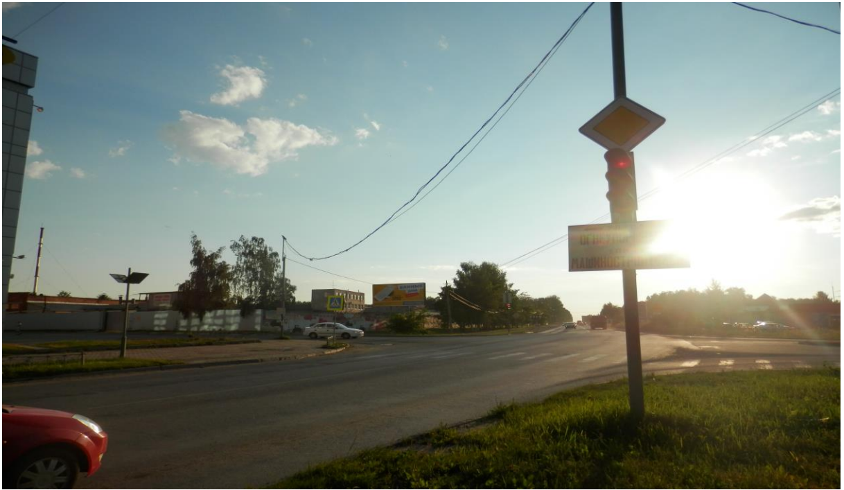
Перекресток улиц Огнеупорщиков – Ленина – Машиностроителей