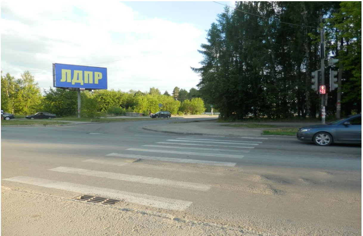
Пешеходный переход на перекрестке улиц Ленина – Сварщиков