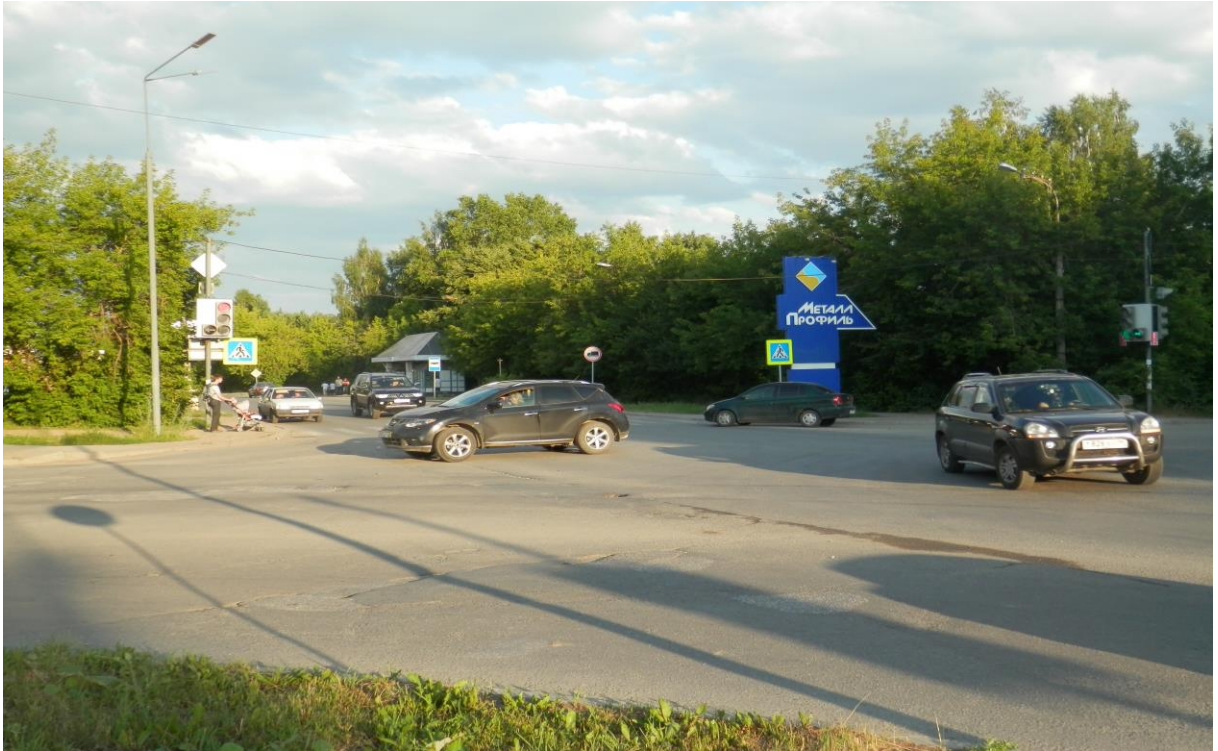
Перекресток Уральских рабочих – Ленина – Сварщиков