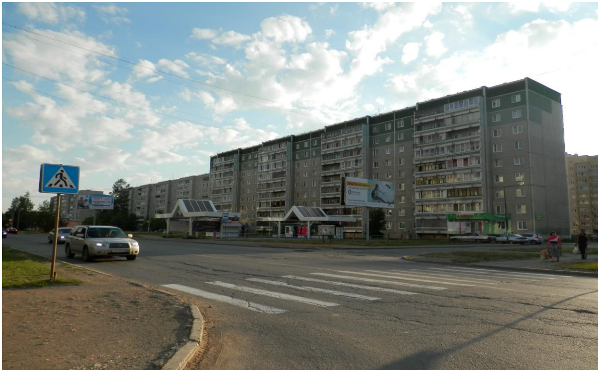
Пешеходный переход на улице Уральских рабочих (остановка «Дом ветеранов»)

1. Фотографии пешеходных переходов и светофоров при движении транспортных средств и детей (обучающихся, воспитанников) вблизи образовательного учреждения.