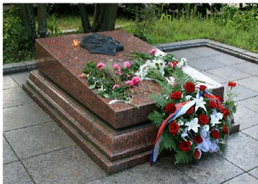
Могила Н.И. Кузнецова на Холме Славы во Львове

Указом Президиума Верховного Совета СССР от 5 ноября 1944 года за исключительное мужество и храбрость при выполнении заданий командования Николай Иванович Кузнецов был посмертно удостоен звания Героя Советского Союза. Награждён 2 орденами Ленина.