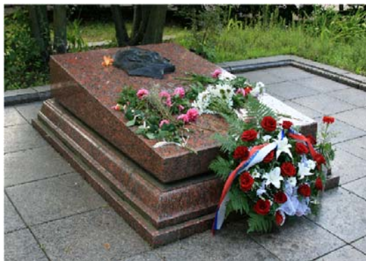
Могила Н.И. Кузнецова на Холме Славы во Львове

Указом Президиума Верховного Совета СССР от 5 ноября 1944 года за исключительное мужество и храбрость при выполнении заданий командования Николай Иванович Кузнецов был посмертно удостоен звания Героя Советского Союза. Награждён 2 орденами Ленина.